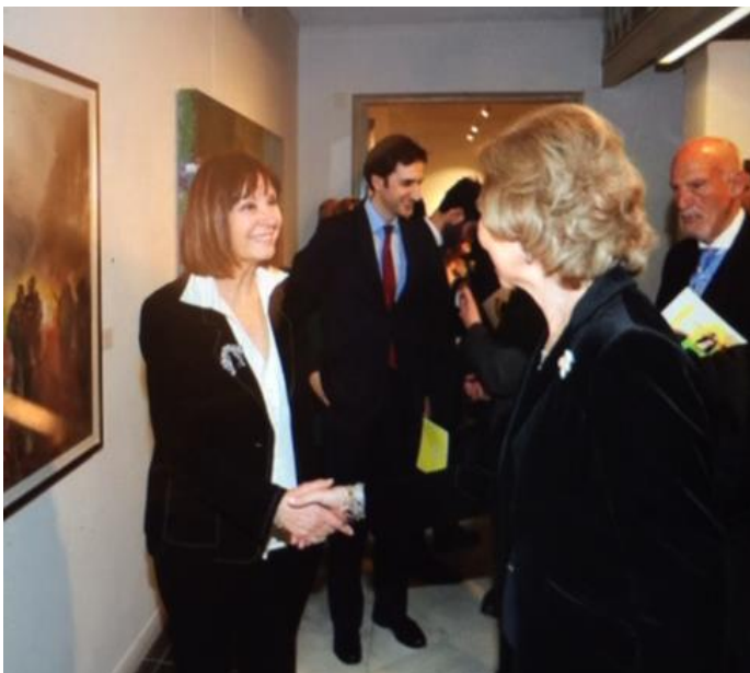
Con S.M. la Reina Sofía en la entrega de Premios Reina Sofía en Casa de Vacas (Madrid)

Alcobendas, su ciudad de residencia, ha acogido su obra en el Centro de Arte y en el Centro Cultural “Anabel Segura” , las exposiciones han gozado del favor del público en general, de las personalidades del sector y de la crítica especializada.