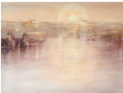
Amanece en Estambul

Mención aparte merecen los autoretratos, si bien todos son acuarelas,