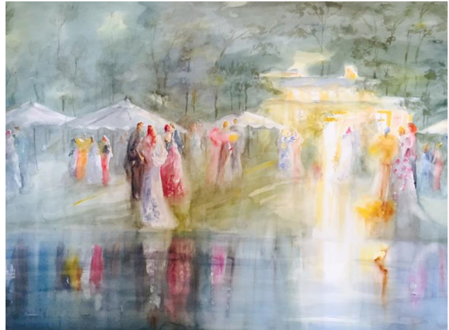
Fiesta en la noche

Acumula numerosos premios y distinciones, como la Medalla de Oro en el concurso internacional de Béziers Francia o la Medalla Reconocimiento a la labor cultural que le fue concedida por el Ayuntamiento de Alcobendas. Según los recibía los iba colocando en su estudio... ya no tiene más paredes o estanterías donde ubicarlos.